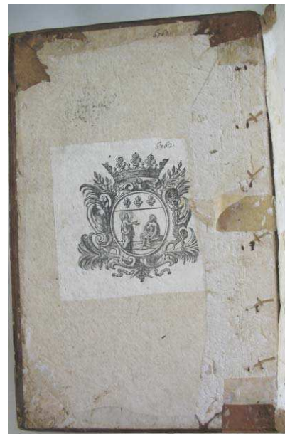
figure 12. contreplat supérieur