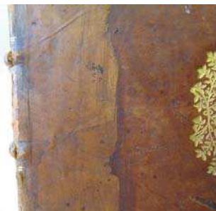
figure 2. plat supérieur

Cette ancienne restauration présente les particularités suivantes : le dos et les coins ont été restaurés à l'aide d'une peau de basane collée sur la peau d'origine. Le dos a été couvert de deux morceaux de peau qui se chevauchent horizontalement sur environ 3 cm entre le 3 e et le 4 e nerf. Cette peau finement parée recouvre les plats sur une largeur irrégulière de 6 cm maximum (FIG. 2 et 3).