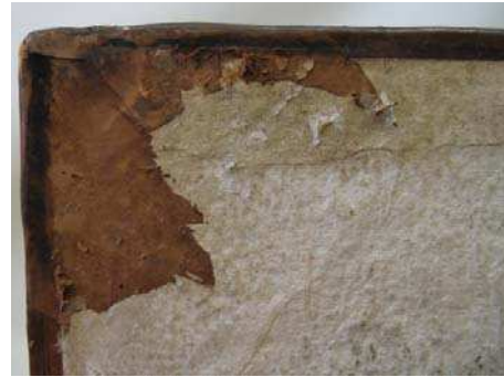
figure 10. après