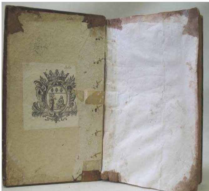
figure 11. contreplat supérieur et sa garde

Le précédent restaurateur n'a pas pris soin de décoller les anciennes gardes. La peau de basane est rempliée sur les gardes d'origine. Les claires anciennes collées aux contreplats ont disparu. Elles ont été décollées, emportant avec elles une large bande de la garde ancienne également collée au contreplat. Seules trois bandes de parchemin ont été ajoutées pour assurer plus de solidité (FIG. 11). Le feuillet ajouté alors masquait : la garde ancienne devenue lacunaire, les remplis, une cote ancienne (6762) et un ex-libris portant la même cote, collé au contreplat supérieur.