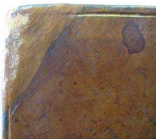
figure 6. avant

Les coins : un cataplasme de colle d'amidon est déposé à la surface de la basane. Une fois humidifiée, la peau est décollée laissant apparaître le coin d'origine dont la peau est en très bon état de conservation (FIG. 6 et 7).