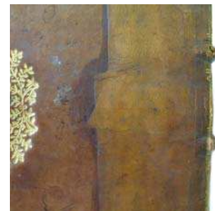
figure 3. plat inférieur