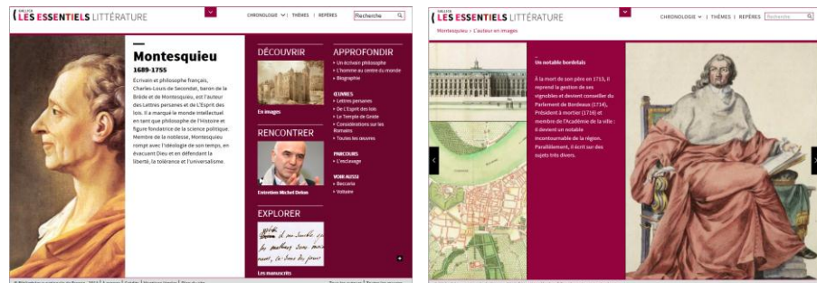
Fig. 4. Les Essentiels : module auteur

Les entrées auteurs et œuvres se déclinent en modules plus ou moins élaborés, afin d'offrir une logique de découverte par niveaux. Les modules principaux