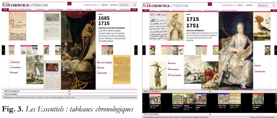
Fig. 3. Les Essentiels : tableaux chronologiques

Ces tableaux chronologiques se présentent comme des « cimaises virtuelles » avec un accrochage hiérarchisé des œuvres : au centre, un choix d'œuvres « majeures » accessibles par une grande image, de petites vignettes interactives signalent d'autres œuvres importantes de la période, tandis qu'un bouton « plus d'œuvres » affiche des titres complémentaires. Il ne s'agit pas ici d'un jugement de valeur, mais d'une modalité d'affichage qui tient compte du niveau d'éditorialisation des contenus proposés. Il importe de rester dans un volume de 20 à 30 œuvres par tableau. Le nom des auteurs phares renvoie vers leurs modules respectifs. Le contexte est documenté par des repères historiques, artistiques et scientifiques accessibles sous forme de fiches qui renvoient vers des requêtes dans Gallica.