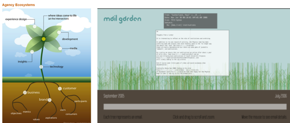
Figure 2 : Exemple d'utilisation du thème graphique du jardin. | Figure 3 : Jardinage d'e-mails

On pourrait multiplier les exemples de ce type de sites 17 qui font un usage très basique de l'analogie du jardin. D'autres vont un peu plus loin dans l'utilisation du jardin, notamment pour expliquer une organisation du travail, par exemple sur ce site d'une agence Web ( http://goo.gl/S4bWi ) qui cherche à mettre en avant l'aspect écosystémique de son approche (Fig. 2). Autre exemple utilisant l'analogie du jardin pour représenter les données présentes dans les écosystèmes d'information : Mail Garden (Fig. 3 : http://goo.gl/YBgmR ) qui fait pousser dynamiquement un champ d'herbe à partir des courriers électroniques, chaque plante représentant un e-mail.