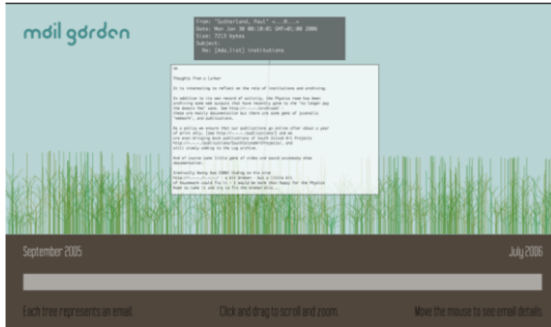
Figure 3. Jardinage d'e-mails