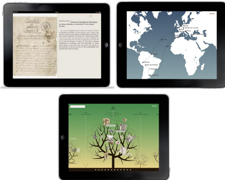
Figure 4. Candide , l'édition enrichie. Trois entrées dans l'œuvre de Voltaire : le livre, le monde, le jardin

L'édition numérique enrichie de Candide , publiée par la Bibliothèque nationale de France (BnF), Orange et la Voltaire Foundation, se présente sous la forme d'une application iPad et d'un site web 22 . Elle propose trois entrées dans l'œuvre de Voltaire : le « livre » ou la lecture enrichie, le « monde » ou l'exploration pédagogique, le « jardin » ou l'appropriation des contenus (figure 4).