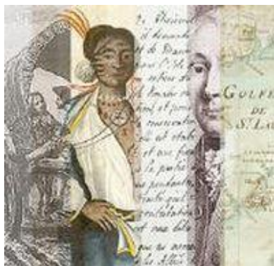
Portail France- Amérique