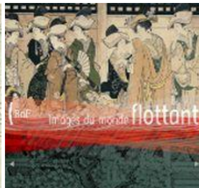
Portail France- Japon

Les portails « patrimoines partagés » ont pour objectif d'illustrer les liens unissant la France, à travers les collections de sa bibliothèque nationale, à l'ensemble du monde et de revisiter son histoire et son patrimoine. Ils permettent la constitution d'ensembles thématiques complémentaires et donnent accès à des documents dispersés entre les différents pays et institutions partenaires, permettant ainsi de reconstituer un héritage commun et de susciter des recherches croisées. Ils illustrent ainsi une politique d'accès numérique comme mode de valorisation d'un patrimoine partagé.