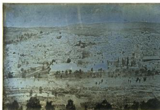
[Jérusalem : vue panoramique prise du Mont des Oliviers] : [photographie] / Joseph Philibert Girault de Prangey, BnF

Ce projet réunit à ce jour sept bibliothèques de recherche constituées depuis le 18 ème siècle par des institutions françaises ou des congrégations religieuses. Elles témoignent, à travers des collections patrimoniales uniques mais encore peu connues, des échanges culturels intenses qui constituent l'identité de l'Orient méditerranéen : l'Institut dominicain d'études orientales (IDEO), l'Institut français d'archéologie orientale (IFAO) et le Centre d'études alexandrines en Egypte, l'Institut français du Proche-Orient et la Bibliothèque orientale de l'Université Saint-Joseph au Liban, l'Ecole biblique et archéologique de Jérusalem, l'Institut français d'études anatoliennes en Turquie. D'autres bibliothèques ont témoigné de leur intérêt et devraient rejoindre le projet en 2017. Le portail pourrait notamment intégrer des fonds dont il ne reste souvent plus que la trace numérique, et notamment de manuscrits religieux issus de fonds irakiens et syriens.