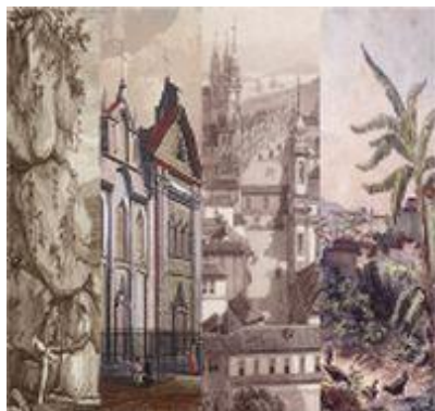
Portail France- Brésil