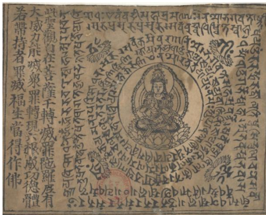
Pelliot sanscrit. Pelliot sanscrit autres séries. Pelliot sanscrit Dunhuang. Image imprimée d'Avalokitesvara - BnF

Souvent d'envergure, portant sur des corpus importants, ces opérations prennent aussi régulièrement la forme de dons des copies numériques de documents uniques pour l'histoire et le patrimoine du pays partenaire.