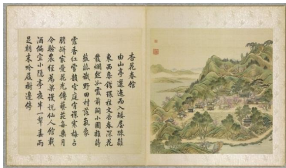
[Le jardin de la Clarté parfaite] : [Palais d'été, Pékin] / [peinture de Tang Dai et Shen Yuan ; en regard, poème de l'empereur Qianlong, calligraphié par Wang Youdu] – BnF

C'est ainsi que le président de la BnF a remis en avril 2015 au directeur de l' Académie de Dunhuang les fichiers haute définition de l'ensemble des manuscrits de Dunhuang conservés au département des manuscrits de la BnF, numérisés dans le cadre du programme international International Dunhuang Project . Ces fichiers ont également fait l'objet d'un don à la bibliothèque nationale de Chine, avec laquelle la BnF a engagé un important programme de numérisation portant sur les relations diplomatiques, culturelles et scientifiques entre la France et la Chine.