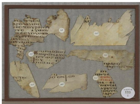
Fragments. Copte 133 (1). Fragments 102-138, BnF

Cette bibliothèque numérique bénéficie d'un soutien en mécénat des Fondations Total et Plastic Omnium. Elle se donne pour double objectif d'assurer la sauvegarde physique et numérique de collections patrimoniales très partiellement numérisées et souvent conservées dans des conditions précaires et de les valoriser dans un portail collaboratif qui témoignera de la permanence et de la vitalité des échanges intellectuels et interreligieux au Levant. Sera ainsi reconstitué virtuellement le lieu d'échanges qu'a été l'espace méditerranéen à travers l'histoire. Multilingue, il donnera accès à plusieurs milliers de documents du domaine public : imprimés, manuscrits, cartes et plans, photographies, affiches, images et, à terme, documents sonores et audiovisuels.