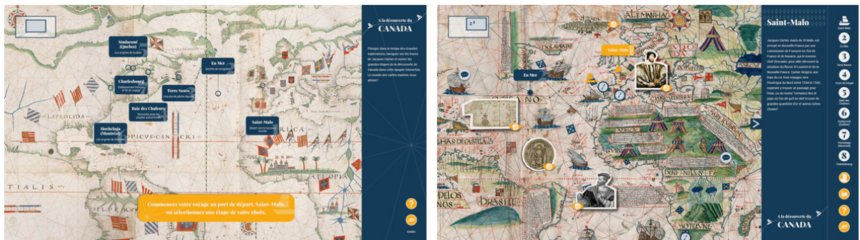
Sommaire des étapes du voyage de Jacques Cartier

Lorsque le dispositif n'est pas utilisé, l'interface de veille anime des éléments l'application pour expliciter le fonctionnement et donner envie de manipuler la table tactile. Le tracé des voyages avec deux bateaux sert à guider l'utilisateur dans l'application. Les papercuts des ressources documentaires sont mis en avant et animés. Ce sont les premiers éléments visuels d'attractivité.