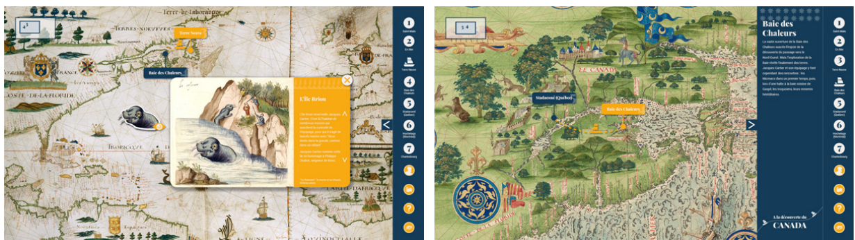
3 e étape : Terre Neuve. Lieu de pêche bien connu des Bretons. Document contextuel sur l'île Brion.