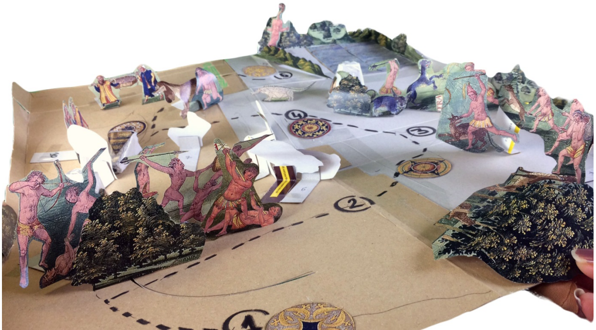
Maquette de conception du parcours

exemple, le coup de canon retentissant dans le dos de l'utilisateur dans la première scène le fait se retourner pour se retrouver face à la bataille navale. La spatialisation du son permet ainsi d'obtenir un mouvement de la part de l'utilisateur sans que celui-ci s'y sente contraint et de l'amener à focaliser son attention sur un élément précis en jouant sur sa réaction naturelle. La complémentarité entre la construction du décor et le son binaural rend crédible l'environnement virtuel dans lequel évolue l'utilisateur. Grâce à la bande son travaillée en parallèle du scénario, l'utilisateur prend possession de l'espace virtuel et peut se plonger totalement dans l'expérience.