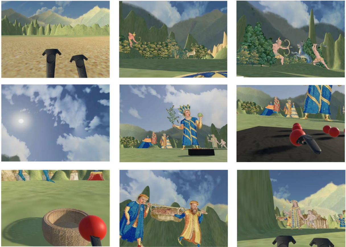
Captures d'écran de la phase de jeu

faune, flore, décor) proviennent directement des cartes de la Terre australe présentes dans la Cosmographie . Toute la difficulté est d'intégrer de manière harmonieuse les éléments 2D dans un environnement 3D et proposer un ensemble cohérent visuellement qui soit le plus immersif possible, tout en conservant l'identité de la Cosmographie . La solution retenue a été de superposer des éléments détournés et assemblés pour créer des scènes sur le principe du théâtre de papier. Les figures sont placées à différentes échelles et sur des plans différents, ce qui donne une impression de perspective et crée une profondeur de champ permettant de se placer. Seuls certains éléments d'ambiance inexploitable en 3D, comme les environnements terrestres et marins, ont été recréés à partir de modèles en utilisant les textures présentes dans l'atlas.