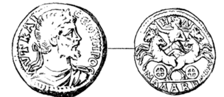
Fig. 9. Monnaie de Madaba, Jordanie, de l'époque de Septime Sévère (193-211) (d'après Seyrig 1937, p. 45, fig. 32)