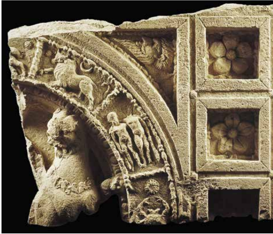
Fig. 13. Fragment de soffite avec les signes du Zodiaque daté de 160–260 ap. J.-C. (d'après Zenobia 2002, p. 80, fig. 91 ; conservé au Musée de Palmyre)

d'un plafond sculpté trouvé dans le secteur du Temple aux Enseignes à Palmyre 38 (fig. 13), un corps de lion de profil avec la tête retournée vers le spectateur et la patte posée sur le cadre du relief qui rappelle d'assez près les figures de lions de notre relief. Pour Michalowski, cette représentation centrale peut avoir été un Dionysos chevauchant un tigre ou une panthère, mais la restitution d'un attelage déployé de lions n'est pas impossible car on identifie une crinière. Toujours dans le secteur du Temple aux Enseignes à Palmyre, un fragment de relief figurant un lion de profil tournant la tête vers le spectateur pourrait également avoir fait partie d'un attelage de félins 39 .