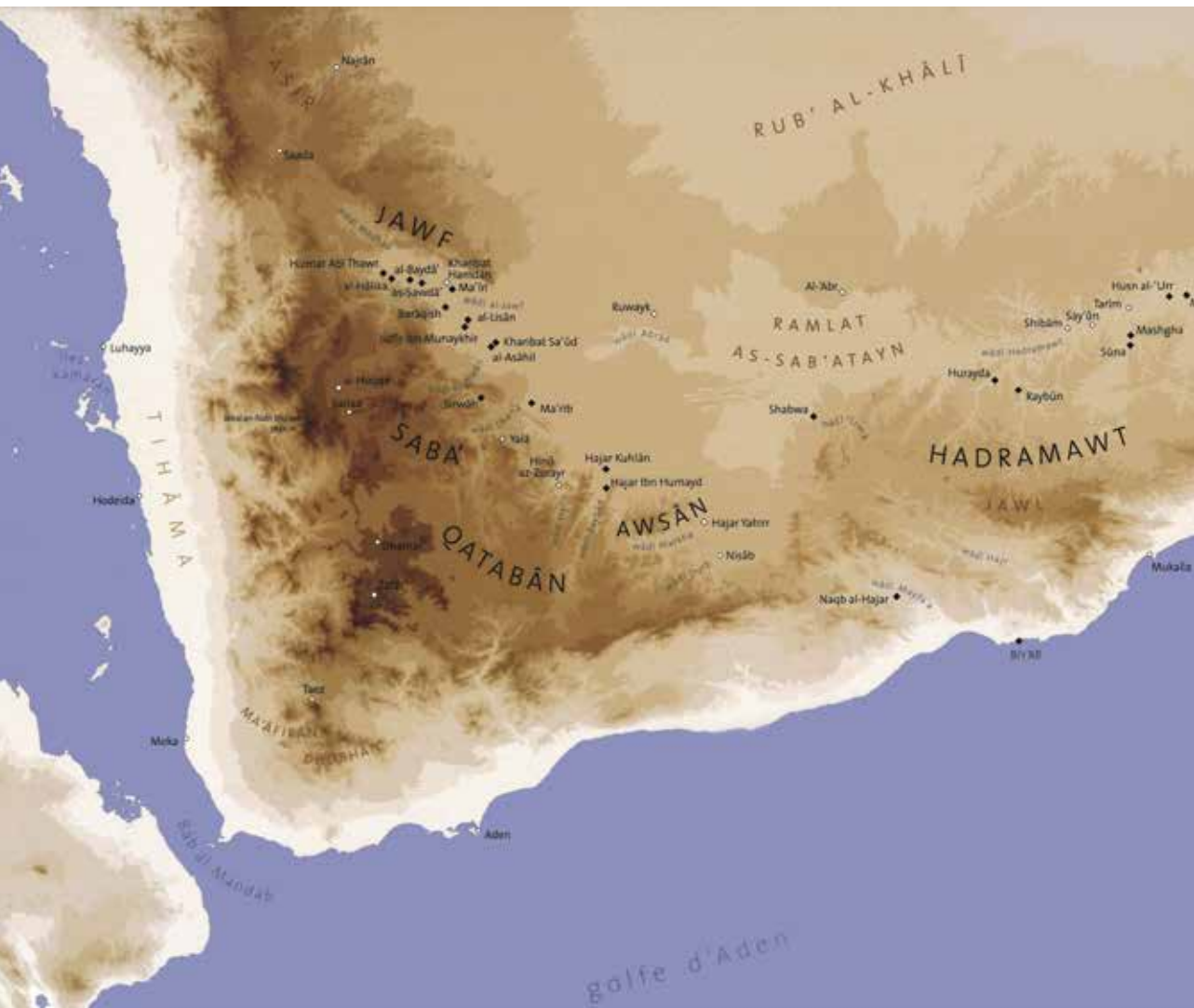
Fig. 2. Carte de l'Arabie du Sud

cassée en trois morceaux et que la tête du personnage central est incomplète. Ces deux reliefs ont-ils été volontairement cassés et les figurations mutilées ?