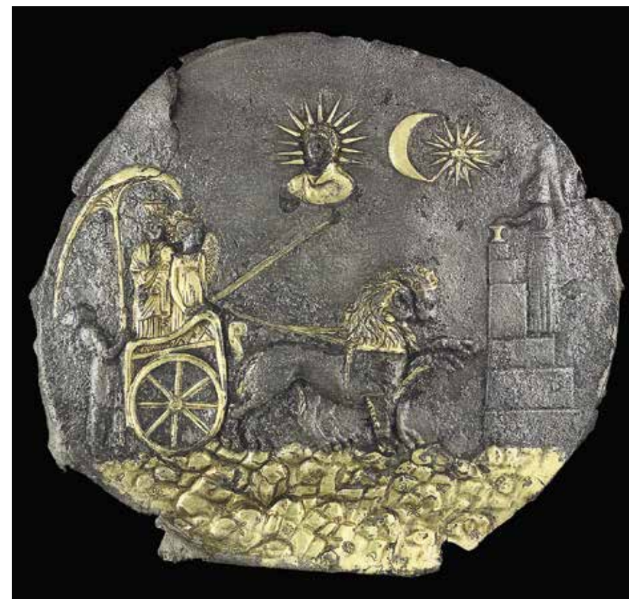
Fig. 10. Plaque de Cybèle, Aï Khanoum, Afghanistan, III e -II e s. av. J.-C. (d'après Afghanistan, les trésors retrouvés 2006, p. 156, n° 23)

la forme, souvent ronde ou ovale, et du format du motif. Sur nos reliefs, nous voyons l'adaptation du motif à un rectangle nettement plus large que haut. De ce fait, les roues peuvent être déportées latéralement par rapport aux animaux de l'attelage pour une meilleure lisibilité de la scène.