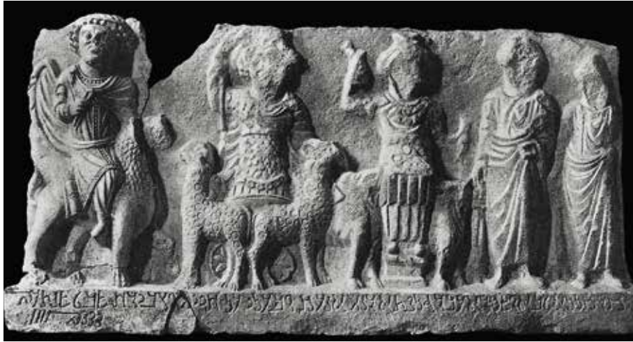
Fig. 11. Palmyrène du Nord-Ouest, bas-relief de Kheurbet Abou Douhour, dédié à Malka en février 263 (d'après Schlumberger 1951, p. 82, 83, pl. XXXVIII, fig. 2)

ro-mésopotamien 27 . Le motif de Cybèle montée sur un char attelé de lions vient du monde grec, mais l'iconographie de la scène la rapproche de ce que nous savons de la grande déesse syrienne Atargatis 28 . Dans le domaine syrien d'époque gréco-romaine, le lion est en effet essentiellement associé à la grande déesse syrienne Atargatis 29 et à la déesse arabe Allath 30 , qui a elle-même succédé à Atargatis dans la steppe syrienne 31 , mais le lion est aussi associé au dieu Aphlad, honoré dans la région du Moyen Euphrate 32 . Toujours dans la steppe syrienne, un relief culturel trouvé au nord-ouest de Palmyre à Khirbet Abou Douhour représente trois divinités auxquelles deux fidèles offrent de l'encens 33 (fig. 11). Sur ce relief dédié à Malkâ, le dieu de gauche, vêtu du pantalon et de la tunique parthe, chevauche un griffon, le dieu de droite, cuirassé, est assis entre deux taureaux et le dieu du centre, cuirassé lui aussi, est debout sur un char avec un attelage déployé de félins tachetés, « fabuleux, ailés et peut-être cornus », selon Schlumberger. Il s'agit donc de fauves chimériques, plus ou moins assimilables à des griffons. On remarque sur ce relief provincial que les trois dieux présentent trois formes de domination des fauves. Le dieu central sur son attelage déployé est représenté sur un char dont les deux roues sont figurées de face, de façon irréaliste, comme