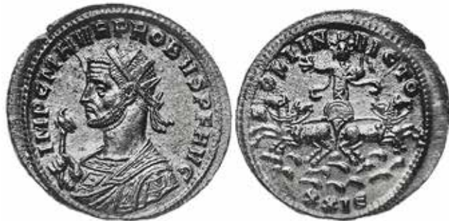
Fig. 5. Monnaie de Marcus Aurelius Probus (276-282)

Le relief qui nous intéresse appartient au domaine des dieux car le char est tiré par des fauves et que le conducteur n'a pas besoin de les guider puisqu'il est leur maître. Il est dans une position frontale de domination et de théophanie accentuée par le geste de son bras droit levé et le sceptre tenu du bras gauche. Sur des représentations de même type, cette gestuelle se reconnaît, par exemple, sur des gemmes d'époque et d'iconographie gréco-romaine (fig. 4) 9 , sur de nombreux monnayages 10 (fig. 5) et sur des mosaïques de synagogues de Palestine (fig. 6), dont J. Magness rapproche l'iconographie des courants du Christianisme contemporain 11 . La même gestuelle se trouve