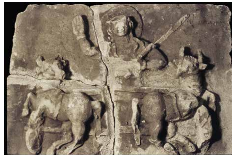
Fig. 3. Bas-relief du musée d'Ataq (Yémen) (n° ATM 479) en provenance du wādī 'Abadān

Plusieurs questions se posent à propos du relief aux félins ou plutôt à propos des deux reliefs apparentés. À quel domaine culturel cette représentation a-t-elle été empruntée ? Quel est le personnage représenté sur le char aux félins ? Et sur le char aux bovins ? Sont-ils originaires d'un même ensemble ? Formaient-ils une paire ou appartenaient-ils à un ensemble figuré plus important ?