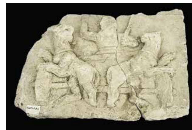
Fig. 1. Bas-relief avec attelage déployé (Musée de l'Université d'Aden)

vêtement ceinturé à la taille. Il élève le bras droit avec l'avant-bras à la verticale. La main droite élevée est manquante. Le bras gauche replié tient un sceptre ou une hampe. Le visage est manquant, sans doute martelé. On devine de longues mèches de cheveux tombant sur les épaules. La partie inférieure de son corps est dissimulée derrière l'avant du char. Ce personnage n'est pas à proprement parler un conducteur de char car il ne retient pas les animaux de l'attelage avec des guides. Le char est également vu de face et figuré de façon réaliste, mais sommaire. Sa représentation est réduite au bord supérieur de la caisse du char, rendu par un bandeau, et aux deux roues épaisses reliées par l'essieu. On remarque que cet essieu est maladroitement représenté car il n'est pas rectiligne. Le char est tiré par deux grands félins symétriques dressés sur leurs pattes arrière, l'une est appuyée au sol et l'autre repliée en l'air. L'une de leurs pattes antérieures semble posée sur la roue et l'autre est levée. Les deux corps divergents sont de profil tandis que leurs têtes sont retournées vers l'avant et le centre de la composition. Les têtes aux gueules entrouvertes sont partiellement cassées, peut-être martelées. On remarque que ces félins ont des crinières. Le harnachement est rendu par le bandeau du col et la sangle de poitrine mais les guides n'ont pas été représentées.