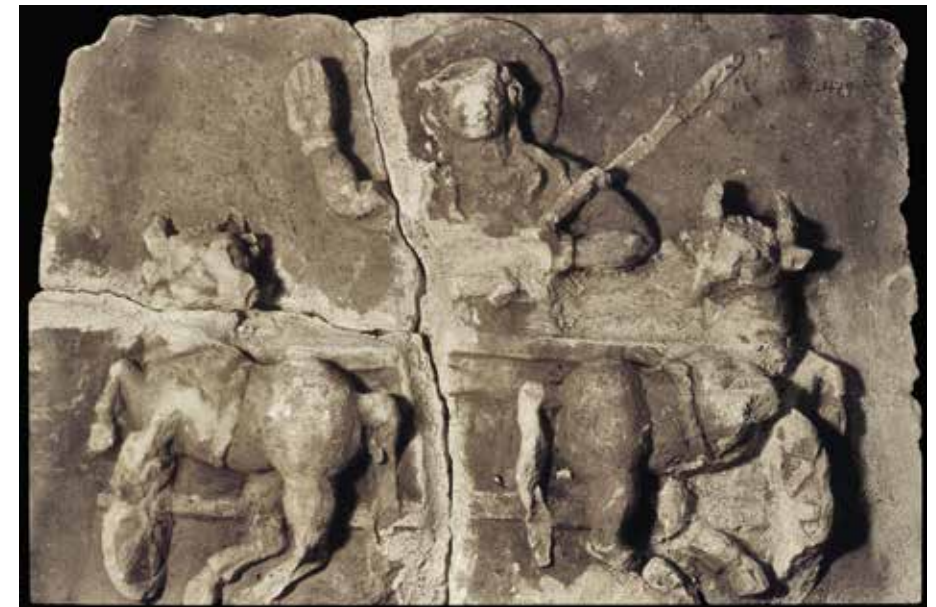
Fig. 3. Bas-relief du musée d'Ataq (Yémen) (n° ATM 479) en provenance du wādī 'Abadān

Plusieurs questions se posent à propos du relief aux félins ou plutôt à propos des deux reliefs apparentés. À quel domaine culturel cette représentation a-t-elle été empruntée ? Quel est le personnage représenté sur le char aux félins ? Et sur le char aux bovins ? Sont-ils originaires d'un même ensemble ? Formaient-ils une paire ou appartenaient-ils à un ensemble figuré plus important ?