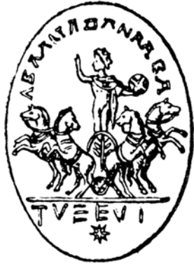
Fig. 4. Gemme magique gréco-égyptienne, III e -IV e siècle (d'après Seyrig 1937, p. 51, fig. 37 = Seyrig 1938, p. 93, fig. 37)

lénisée des athlètes, des guerriers et des dieux sur des chars tirés par des chevaux, sur terre et dans les cieux 8 .