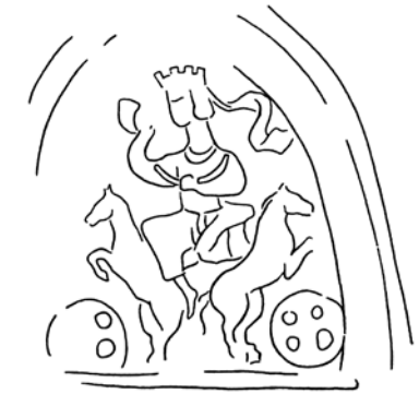
Fig. 7. Relief de bois de Pendjikent, début VIII e s. (d'après Grenet 2001, fig. 7, dessin Shkoda 1980, fig. 2 :5)

aussi sur des représentations de Mithra dans le monde iranien et en Asie centrale 12 (fig. 7) au contact du domaine bouddhique 13 (fig. 8). Sur ces représentations dans des domaines culturels différents, de la Méditerranée hellénisée à l'Asie centrale, la théophanie sur un attelage déployé a clairement une symbolique astrale. Comme dans le monde grec avec Helios, le char est le symbole de la course céleste du soleil. Cette symbolique solaire est affirmée de façon éclatante sur la mosaïque de la synagogue de Sepphoris sur laquelle le conducteur du quadriges déployé est remplacé par le soleil représenté avec ses rayons lumineux 14 . Cette figuration solaire avec un attelage déployé est en forme de cercle et encadrée par un Zodiaque également de forme circulaire. On remarque aussi qu'à droite du soleil