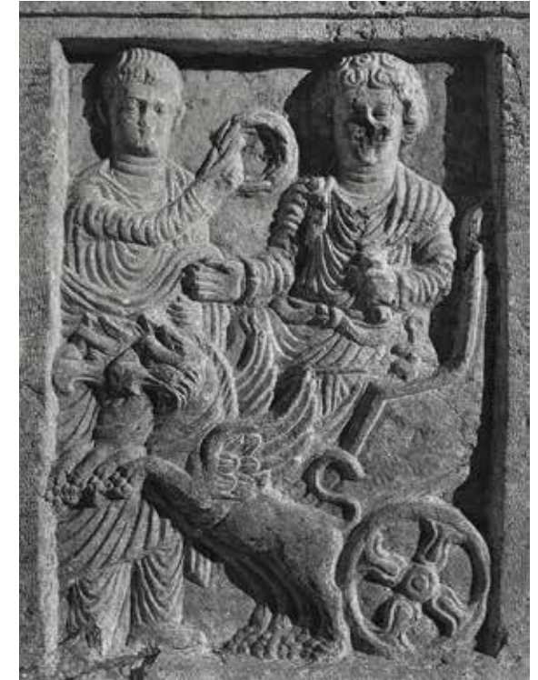
Fig. 12. Pyrée du sanctuaire de Baalshamin à Palmyre (d'après Dunant, Stucky 2000, p. 83, 84 et pl. 3, fig. 3, en haut à droite ; conservé au Musée de Palmyre)

sur la monnaie de Madaba (fig. 9). De plus, sur le relief de Palmyrène, ces deux roues sont représentées par deux rosettes à pétales