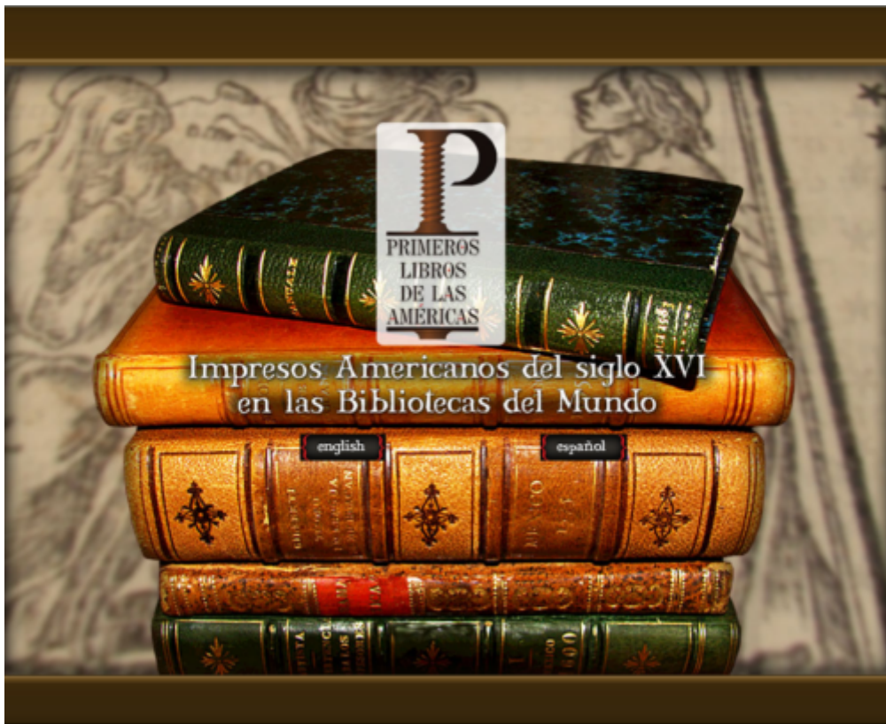
Primeros Libros de las Américas

Si les premières collections d'imprimés mexicains constituées par des savants et érudits mexicains ont été dispersées en salle de vente au cours du XIX e siècle, l'État mexicain se soucie désormais de ce patrimoine bibliographique qui lui a longtemps échappé. En décembre 2002, la bibliothèque nationale du Mexique et la Biblioteca Cervantina de Monterrey ont émis une proposition d'inscription au registre de la mémoire du monde pour l'Amérique latine et la Caraïbe (MOWLAC) de leurs collections d'incunables américains : Propuesta para Registro de Memoria del Mundo. Incunables Americanos, Libros Impresos en México en el Siglo XVI 19 .