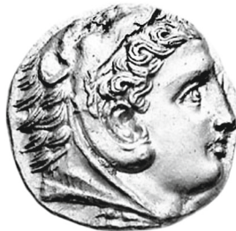
Vente Triton, 10 jan. 2006, n° 724 (8,60 g)