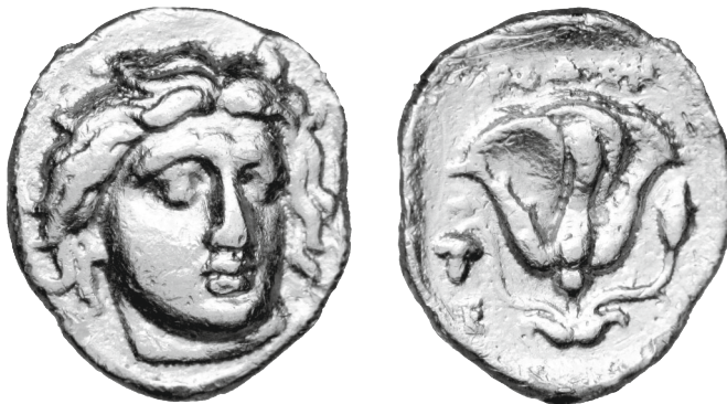
Vente CGB, Monnaies 47, 19 mars 2011, n° 121 (7,97 g).

Quant aux trois statères rhodiens de poids attique qui figuraient dans la trouvaille de Saïda (et sont aujourd'hui conservés dans les cabinets des médailles de Berlin, Londres et Paris), voici ce qu'en dit U. Westermark: «On the evidence of the Rhodian silver coins found in the excavations of Kastabos in Caria, M. Price suggested that the staters and the silver coins with corresponding symbol and letter "may be connected with the arrival of Macedonian supremacy in the island in 333-2 B.C." This assumption agrees with the fact that the three specimens in the Saida hoard are not excellently preserved but also of the same obverse and reverse dies, which indicates that they probably belong to a series, struck not long before the concealment of the deposit» 16 . Un quatrième exemplaire est tout récemment passé en vente à Paris, lui encore frappé avec les mêmes coins de droit et de revers, mais d'une conservation nettement plus altérée que les exemplaires de Saïda, en sorte que je ne crois pas qu'il puisse appartenir à la trouvaille «statères de Pergame 2004».