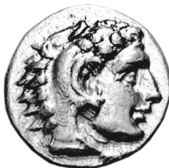
Vente CNG, MBS 70, 21 sept. 2005, n o 92 (4,29 g)