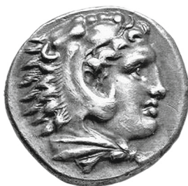
Vente Leu, 81, 16 mai 2001, n o 182 (4,25 g)