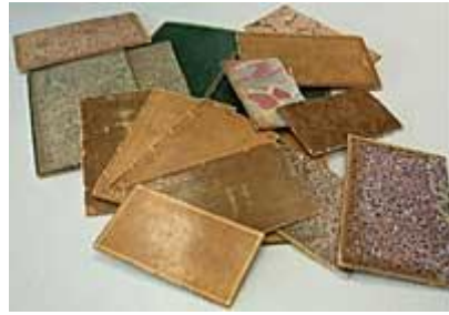
(1) Plats déposés d'ouvrages dont la reliure a été refaite

Ce constat suffit-il à ne plus utiliser les cuirs de tannages végétaux pour le traitement de reliures anciennes ? Non, mais sans établir une liste exhaustive des cas où leur emploi reste incontestable, il devrait suffire les en écarter à chaque fois que cela est possible ! Certains de nos confrères anglo-saxons, plus particulièrement au USA ont estimé quant à eux, au sein d'une approche plus globale et moins interventionniste 4 , il y a maintenant une dizaine d'années, que le papier japonais, parmi d'autres matériaux, pouvait se substituer parfois très avantageusement au cuir 5 . Ceci est vrai non seulement en termes de qualités intrinsèques (propriétés physico-chimique 6 : permanence, résistance, souplesse...) mais aussi