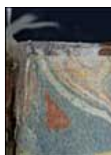
(11) Le papier est rempli sur les contreplats.

En l'absence de tranchefiles (cas fréquent), la partie de papier dépassant sera laissée suffisamment longue (1,5 à 2 cm) et découpée en plusieurs petites lanières (illustration n° 12) qui seront insérées dans le corps d'ouvrage de façon à créer une sorte de « bâti » 11 (illustration n° 13 et 14). Cette dernière solution permet de restituer une très grande solidité à cette partie de l'ouvrage.