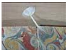
(5) Collage du papillon sur un contre plat

Cette décision sera prise à la suite d'observation concernant le papier contre-collé (s'il est fin ou épais, glacé ou non, très bien collé ou peu adhérent, de couleur ou blanc 10 ...).