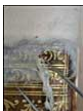
(10) Le surplus est éliminé à l'aide d'une pince Brucelles.