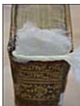
(8) Pose du papier de maintien du "papillon". Une partie de cette bande de papier est