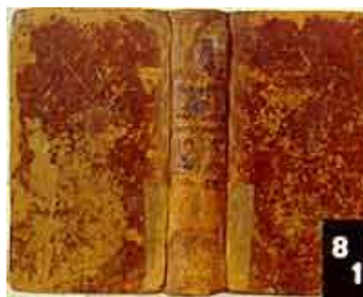
(2) Ouvrage du XIXe siècle

Malgré un décor à froid sur le dos, cette reliure ne présente pas d'autre intérêt, selon nos critères actuels, que d'être à peu près contemporaine du livre et la première réalisée sur cet ouvrage. On ne peut pas nier la valeur d'ancienneté. La valeur archéologique est seulement potentielle. La valeur d'usage quant à elle est prépondérante et la consultation doit être assurée. Si la cohérence de l'ensemble est toujours préférable, le principal critère de décision quant au traitement sera son coût. Pour cet ouvrage, la restauration a été faite avec du papier japonais