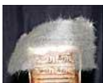
(9) Pose de la dernière bande de papier

Pour la troisième et dernière étape, un papier de grammage moyen (10 à 20 g/m 2 ) doit être prélevé. Sa largeur sera celle du dos plus un ou deux centimètres par plat et sa hauteur devra être de 4cm environ. Dans un premier temps, cette bande est posée sur le dos et sur les plats (illustration n° 9). Si elle est collée par-dessus le cuir, ce qui est fréquent, toute la surface non-désirée est éliminée par défibrage afin de dégager au maximum le décor (illustration n° 10). Les largeurs dépassantes, correspondant aux plats sont découpées ce qui permet au papier d'être « rempli » (illustration n° 11).