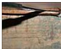
(6) Coupe du chant du plat afin d'insérer le papier lorsqu'on veut éviter de masquer le papier marbré situé sur le contre plat

La seconde étape consiste en la pose d'une deuxième bande destinée à maintenir le « papillon ». Le grammage du papier utilisé ici peut être moindre (de 10 à 20g/m 2 ). Ses dimensions sont la largeur du dos et une hauteur de 1,5 à 2cm. Cette bande est collée sur une surface de 0,5mm sous le cuir (illustration n° 7). La partie dépassant doit entourer la bande torsadée pour ensuite être également introduite sous le cuir et collée (illustration n° 8). L'objectif de cette étape est de maintenir correctement la bande torsadée au corps d'ouvrage. La deuxième partie non torsadée du « papillon » peut alors être collée sur le second contre-plat.